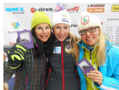
Radost z dobrého umístění a křišťálového přírůstku do sbírky.

Nekompromisní boje o desetiny nemají vliv na přátelské a pohodové klima závodu a prakticky všichni si mají co říct. Jedinečná je atmosféra, kdy se setkávají bývalí aktivní závodníci a reprezentanti i amatérští nadšenci. Zajímavým bonusem závodění masters je samozřejmě společenská rovina, setkávání lidí různých profesí a odlišných podnikatelských činností.